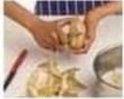
éplucher peel (v)