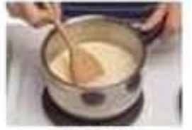
remuer stir (v)