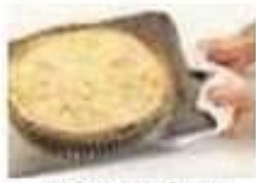
cuire au four bake (v)