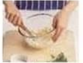
mélanger mix (v)