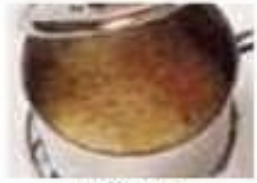
mijoter simmer (v)