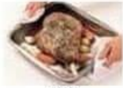
rôtir roast (v)