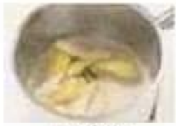
pocher poach (v)