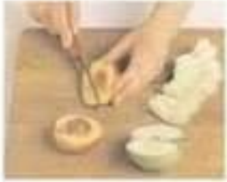
couper slice (v)