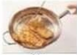
frire fry (v)