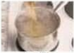
bouillir boil (v)