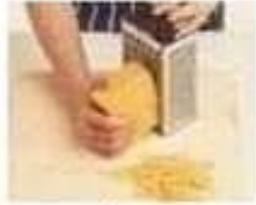
râper grate (v)