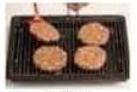
griller broil (v)