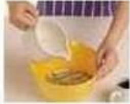
verser pour (v)