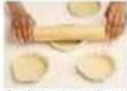
étaler au rouleau roll (v)