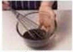
battre whisk (v)